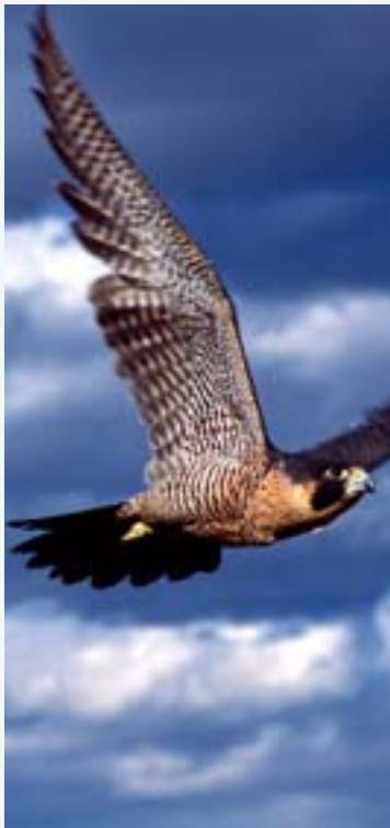
Der Sturzflug des Wanderfalcons ist eine extreme Hochgeschwindigkeitsleistung. Mit Wandern hat das eher wenig zu tun.

Kraniche sind weltweit mit 15 Arten auf allen Kontinenten verbreitet, außer in Südamerika. Wo immer sie vorkommen, haben sie die Menschen fasziniert. Sie beflügeln Fantasie, Poesie und Kunst, kommen in Mythen und Märchen vor. Ihr Balzverhalten, der „Tanz der Kraniche“, hat die Tänze der Naturvölker geprägt. Die Deutsche Lufthansa setzt sich grenzüberschreitend für ihr Wappentier ein, das regional durch Zerstörung des natürlichen Lebensraumes bedroht ist. Bestand: 360.000 bis 370.000 Individuen, regional gefährdet