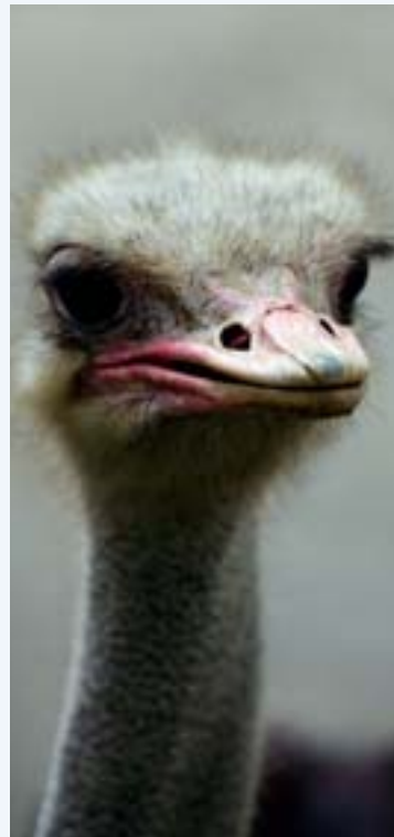
Der Strauß ist Mehrfachrekordhalter: Er ist der größte und schnellste Vogel, der noch dazu das größte Ei von bis zu 1,9 kg Gewicht legt.

Die Grüne Mamba ist eine perfekte Schwimmerin und gehört zu den schnellsten Schlangen überhaupt – in Bäumen wie auf dem Boden. Eine wahre Meisterleistung, wie das filigrane Reptil den bis über zwei Meter langen Körper in völliger Balance sogar über Baumäste bewegt. Aber aufgepasst: Sie zählt auch zu den giftigsten Schlangen Afrikas. Bestand: Nicht quantifiziert