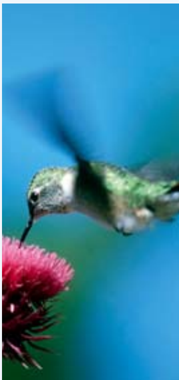
Die beweglichen Flügel erlauben es dem Breitschwanzkolibri, rückwärts, seitwärts und auf der Stelle zu fliegen.