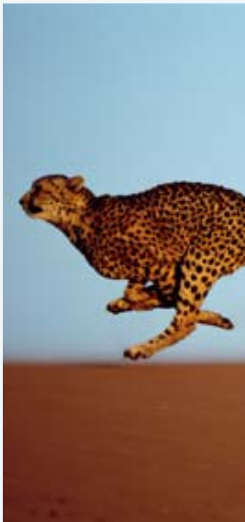
Das Revier des Geparden umfasst bis zu 600 Quadratkilometer. Er ist ein Sichtjäger, liebt Anhöhen, jagt am Tag mit Vorliebe Gazellen.

Kein Tier läuft über eine längere Entfernung so schnell wie der Gabelbock. Auf kurze Distanz könnte er sogar eine Autobahn benutzen. Sein Lebensraum, die offene Prärie, gibt dem Gabelbock keine Möglichkeit, sich zu verstecken. So sind Geschwindigkeit und Ausdauer der einzige Schutz im Überlebenskampf. Ein für Säugetiere großes Herz und große Lungen sowie ein hoher Hämoglobinspiegel im Blut liefern den Sauerstoff. Bestand: Anfang des 20. Jahrhunderts einige Millionen Tiere, heute deutlich dezimiert, geschätzt zwischen 0,5 und 1 Million