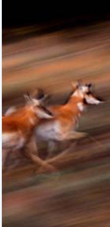
Kräftige Muskeln und lange Beine machen den Gabelbock zum schnellsten Mittelstreckenläufer; in vollem Lauf fliegt er förmlich durch die Luft.