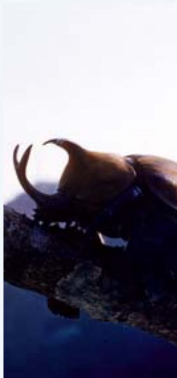
Der Rhinoceros-Käfer: Mit seinem starren Kopf- und beweglichen Brusthorn ist das Kraftpaket ein geschickter Duellant.