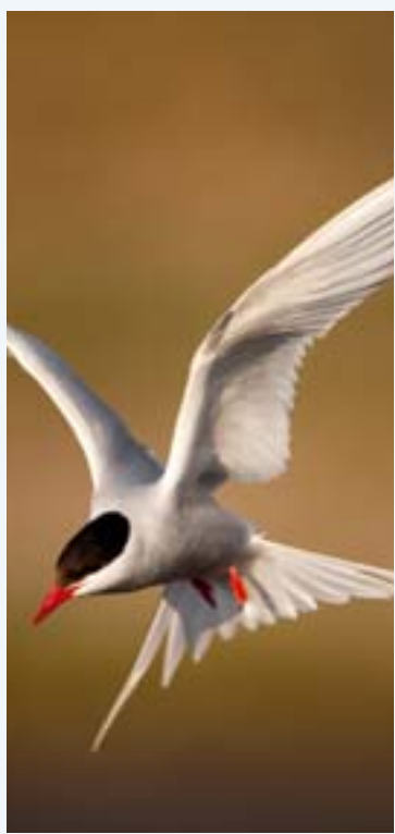
Schlank und aerodynamisch – das sind die Voraussetzungen, um mit geringstem Luftwiderstand die längste aller Vogelreisen anzutreten.