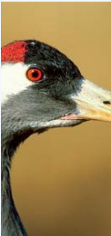
Kraniche beherrschen den Formationsflug, fliegen in Keilen, Winkeln oder schrägen Reihen. Das reduziert den Luftwiderstand.

Brüten in der Arktis und Überwintern in der Antarktis (während des südlichen Sommers). Ein so mobiles Dasein kann nur führen, wer eine Strecke über 15.000 Kilometer Luftlinie und mehr bewältigt. Die Seeschwalben tun dies Jahr für Jahr, kennen den Weg, folgen der Route, als wäre eine Landkarte einprogrammiert. Sie fliegen dabei grundsätzlich entlang der Küsten über Wasser. Kein Wunder, findet die Seeschwalbe dort ihren Kraftstoff in Form von Fisch. Der Zug in die Winterquartiere und wieder zurück erstreckt sich jeweils über einen Zeitraum von vier bis fünf Monaten. Bestand: Nicht quantifiziert