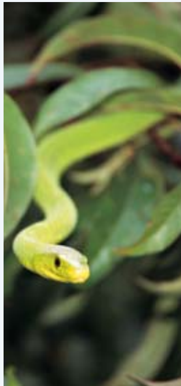
Grüne Mambas sind auf Büschen und Bäumen zu Hause, lieben Land und Wasser gleichermaßen. Sie werden 1,5 bis 2,5 Meter lang.

Höchstens eine Minute dauert die Jagd des unnachahmlichen Sprinters. Der Gepard geht buchstäblich ab wie eine Rakete. Nach nur 200 Metern erreicht er seine Spitzengeschwindigkeit von um die 100 km/h. Danach benötigt er eine Erholungsphase von mehreren Minuten – zum Auskühlen. Diese Spitzengeschwindigkeiten erreicht der Gepard dank eines hochbeweglichen Rückgrates, das eine enorme Schrittlänge erlaubt. Bestand: Geschätzt ca. 12.500 in 25 Ländern Afrikas, im Iran nur noch rund 100