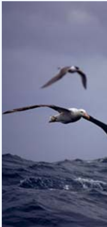
Der beste Wandervogel verbucht noch einen weiteren Weltmeistertitel: Er hat die längsten Flügel mit einer Spannweite von bis zu 3,40 Metern.

Der Wanderfalke fliegt in Grenzbereichen im Formel-1-Tempo. Physikalisch berechnet könnte ein Tier, das ein Kilo wiegt, 385 km/h erreichen. Bei seinen Angriffen aus teilweise mehreren Kilometern Höhe erbeutet der etwa krähengroße Falke hauptsächlich Tauben, Drosseln und Stare. Charakteristisch für seine Beuteflüge sind die kurvigen Flugbahnen, die er häufig für die Annäherung wählt. Bestand: Nicht quantifiziert